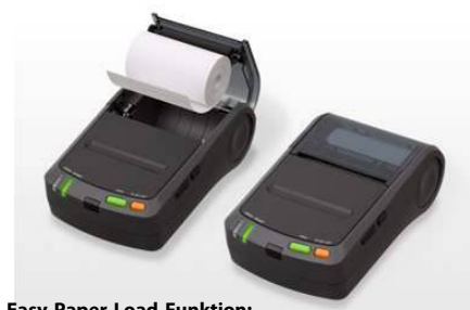
Easy-Paper-Load-Funktion: Schnelles und einfaches Einlegen der Thermopapierrolle

Alle Spezifikationen können ohne vorherige Ankündigung geändert werden.